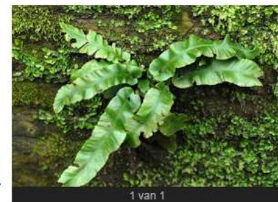
tongvarens op de asch van wijck brug

Deze zeldzame plant groeit gewoon in onze wijk! Voor meer info: zie de gemeentelijke gids voor beschermde planten: