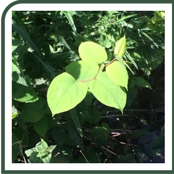
Japanse Duizendknoop langs de Minstream